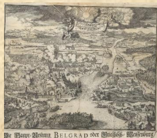
Die Haupt-Stadt BELGRAD der Heiligen-Matthias-Stadt